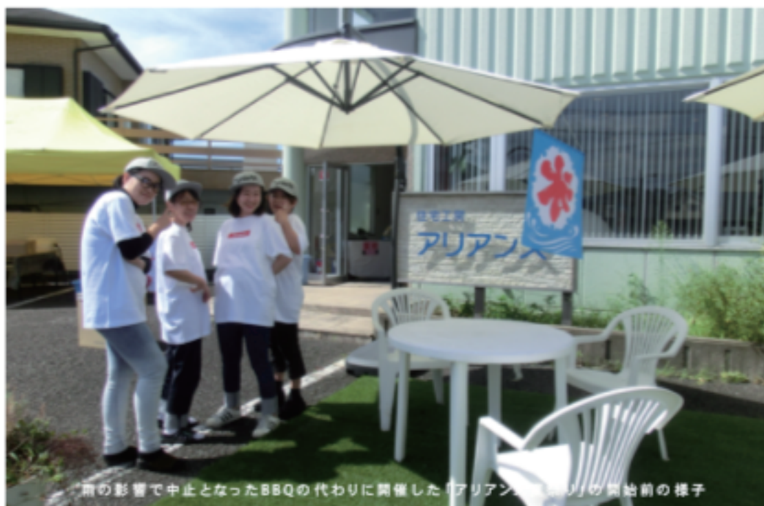
雨の影響で中止となったBBQの代わりに開催した「アリアン」の開始前の様子