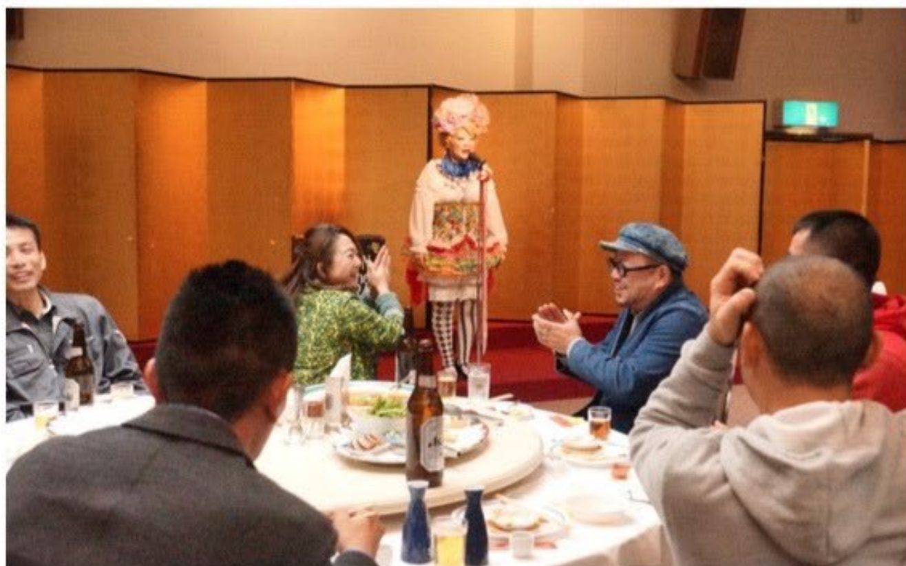
2017年 協力会社さんとの忘年会での一コマ