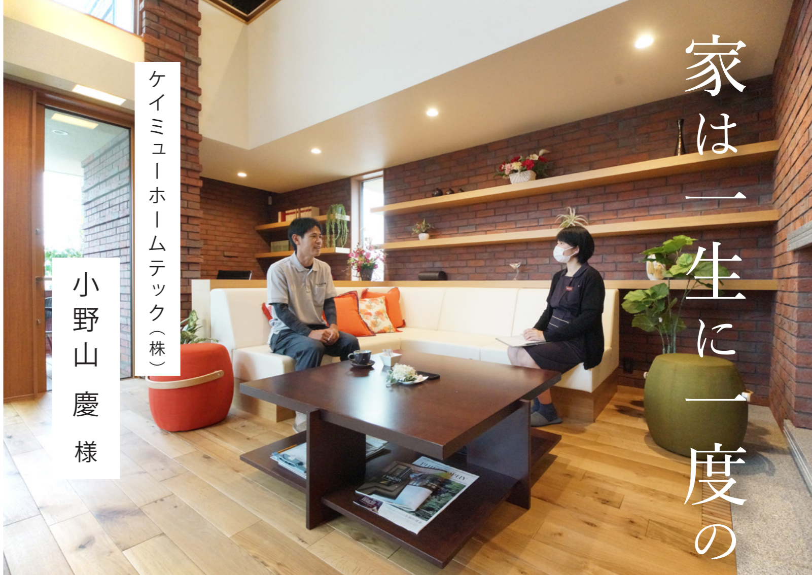
ケイミューホームテック(株)